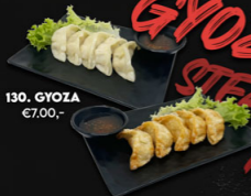
130. GYOZA €7,00,-