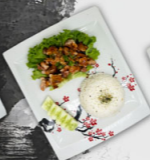
129. BEEF TERIYAKI €18,00,-