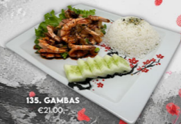
135. GAMBAS €21,00,-