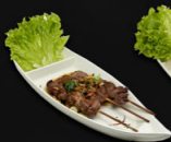
120. LAMS SPIES €12,50,-