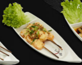
121. GARNAAI SPIES €14,50,-