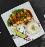
128. ZALM TERIYAKI €20,00,-