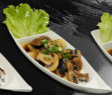
124. YAKI MUSHROOMS €8,50,-