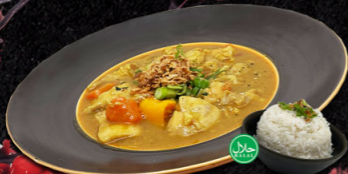
84. KATSU CURRY + RIJST €16.50,-