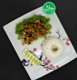
127. CHICKEN TERIYAKI €17,00,-