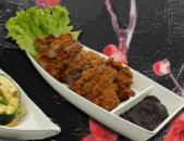
133. GEFRITURDE EEND €16,00,-