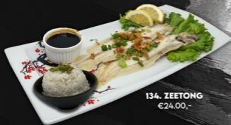
134. ZEETONG €24,00,-