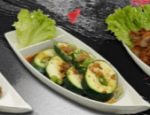
125. YASAI MORI €8,50,-